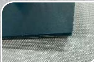
2C 12 U0/P30