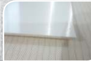
2 F 8 U0 V20 BLANCHE