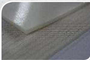
2 F 10 U0 / V26 BLANCHE