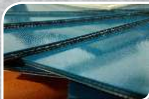
3C 18 U0/P40