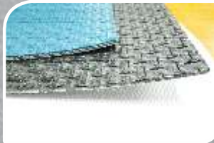
2C 12 LN/ P26 SD