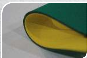
NCT 40 EP 4 mm