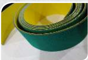
AS -14 EP 1.8mm