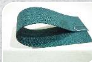
AS -10 EP 1.2mm