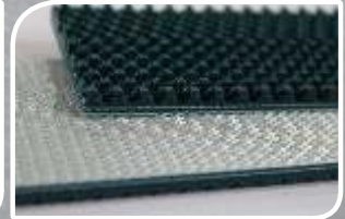
2C 12 LN/ P54 SG