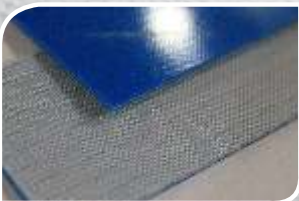
2 PU 12 U0 / U14 BLUE