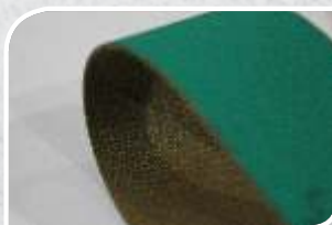
E -15 EP 1.5mm