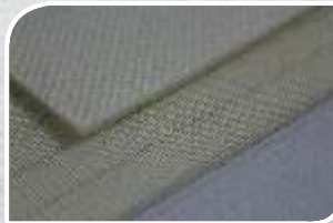
2F8 U0 - V26 GD BLANCHE