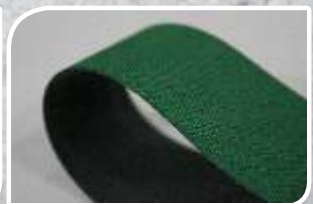
AST -5 EP 0.8mm